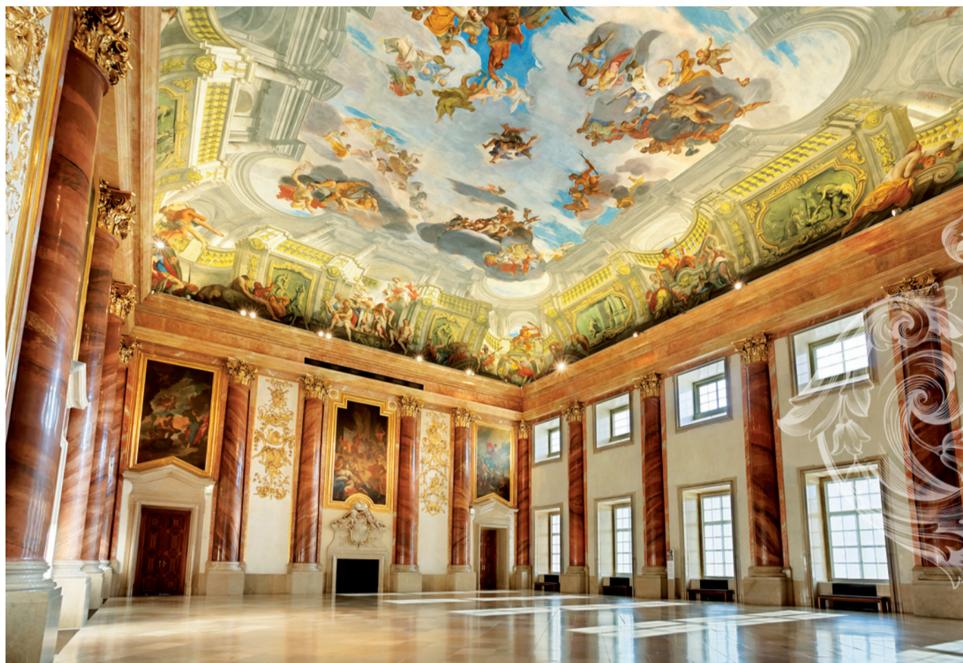
Lichtenštejnský zahradní palác patří ke skvostům vídeňské barokní architektury. Ve čtvrtek 23. září zde Collegium 1704 a Collegium Vocale 1704 neformálně zahájí 6. ročník LVHF. Návštěvníkům koncertu se otevrou i zdejší umělecké sbírky.

Gartenpalais Liechtenstein symbolizuje již více než tři sta let dokonalé spojení přírody, architektury a umění. Opraven do své původní krásy je dnes tento monument vídeňské barokní architektury přístupný pouze v rámci mimořádných akcí. Jednou z takových bude Prolog LVHF 2021. A nepůjde jen o zážitek hudební. V rámci koncertu se návštěvníkům otevrou i unikátní umělecké sbírky tohoto paláce.