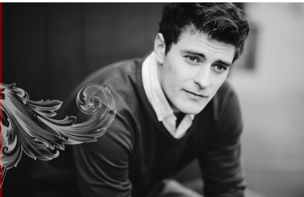
„Člověk musí v něco věřit,“ říká Jakub Józef Orliński, který si pro svůj debut v České republice vybral árie z oper Antonia Vivaldiho.