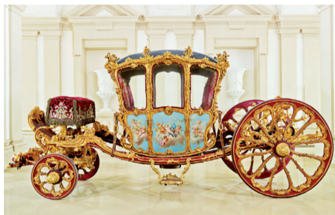
Zlatý kočár vítá ve foyer návštěvníky Zahradního paláce.

Collegium 1704 Nikdy neabsentující energie a nadšení z hudby. Právě tyto kvality udělaly z Collegia 1704 jeden z nejrespektovanějších a nejobdivovanějších evropských ansámbků staré hudby současnosti, o čemž svědčí jeho čtyřnásobné hostování na proslulém Salcburském festivalu od roku 2015. Antonio Vivaldi patří mezi autory, kterým se soubor věnuje s velkou intenzitou. Vedle mnoha dalších skladeb uvedl v roce 2014 v novodobé světové premiéře operu Arsilda, regina di Ponto v režii Davida Radoka, v koprodukcii s Grand Théâtre de Luxembourg, Opéra Royal de Versailles, Opéra de Lille, Théâtre de Caen a Slovenským národním divadlem v Bratislavě. Ve Vídni se zaměří na Vivaldihovo skladby duchovní: zazní rakouská premiéra Laetatus sum RV 607 , dále Laudate pueri RV 600 a především překrásné Dixit Dominus RV 595 , u něhož se dlouho předpokládalo, že existuje pouze jediné zhudebnění tohoto