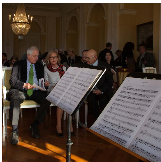
KONCERT NAVŠTÍVIL PRINC WOLFGANG LIECHTENSTEIN SE SVOU ŽENOU