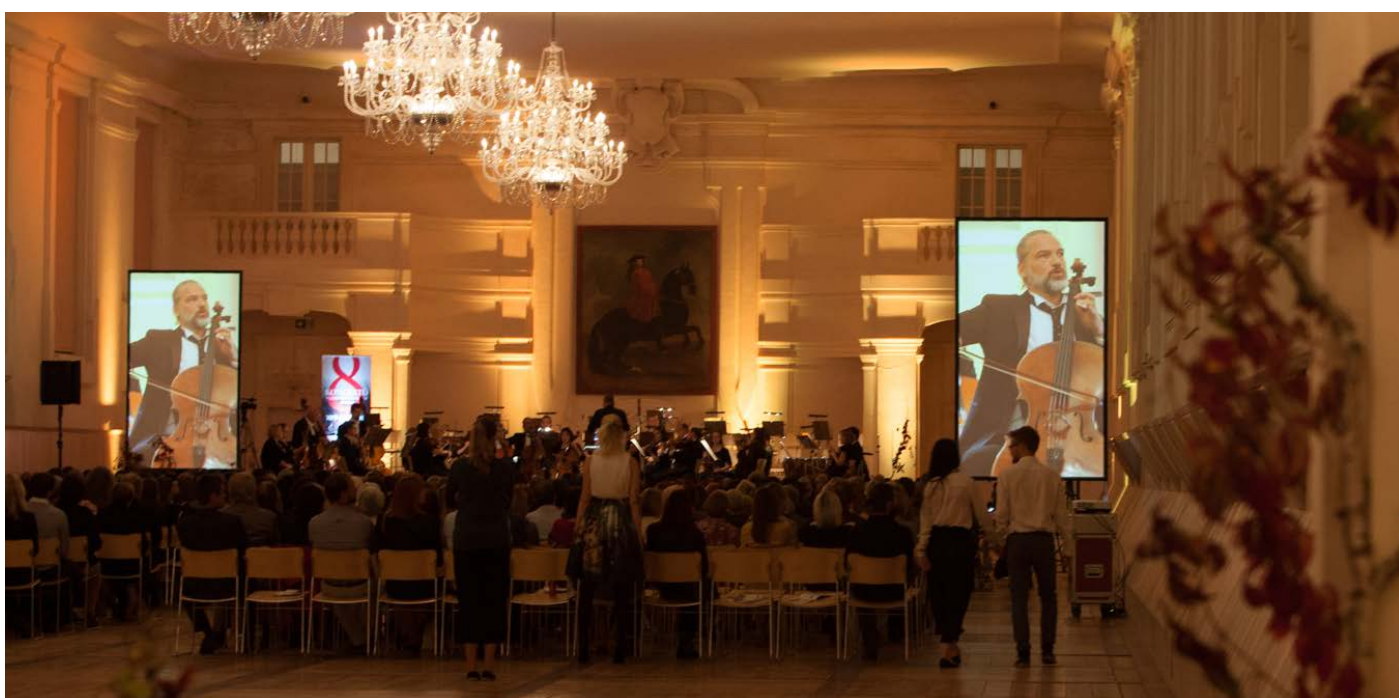
FILHARMONIE BOHUSLAVA MARTINŮ